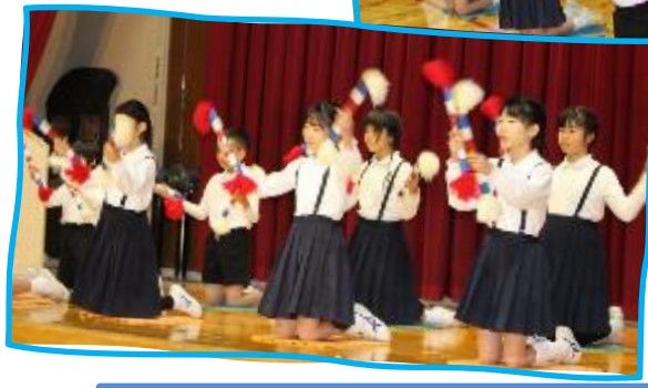
クラブ発表「銭太鼓」