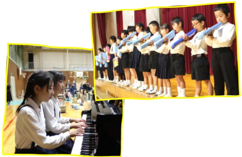
合奏「アイノカタチ」