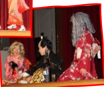
3・4・5・6年「水戸黄門 神代Ver.」